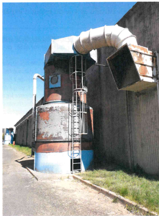
dépoussiéreur concerné par l'incendie