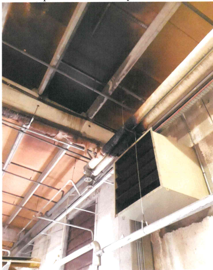
Impact très limité dans le bâtiment suite au sprinklage